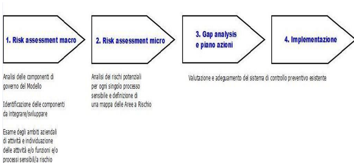
Fig. 2 Progetto 231